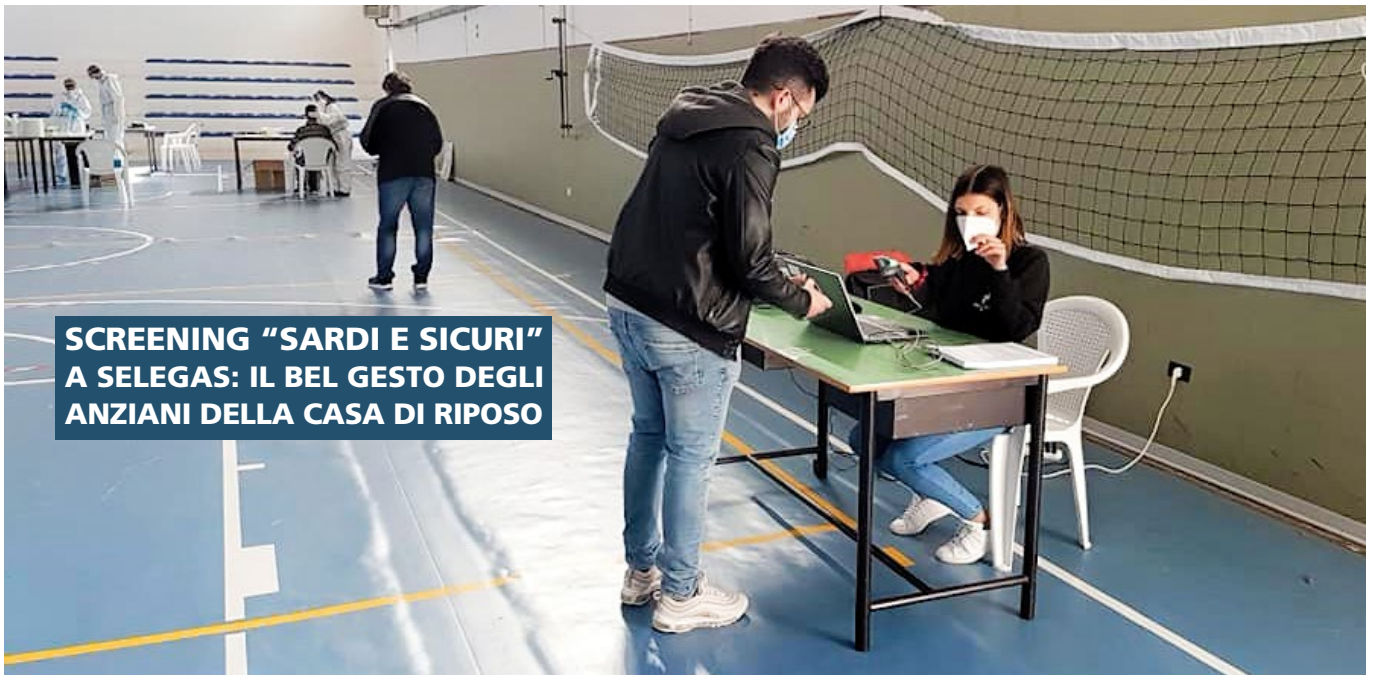
SCREENING "SARDI E SICURI" A SELEGAS: IL BEL GESTO DEGLI ANZIANI DELLA CASA DI RIPOSO

G li anziani della casa di riposo di Selegas hanno offerto il pranzo agli operatori sanitari e ai volontari impegnati, sabato 13 marzo, nella campagna di screening "Sardi e sicuri". Gli ospiti della struttura residenziale "Beato Fra Nicola da Gesturi" hanno voluto ringraziare così le persone im-