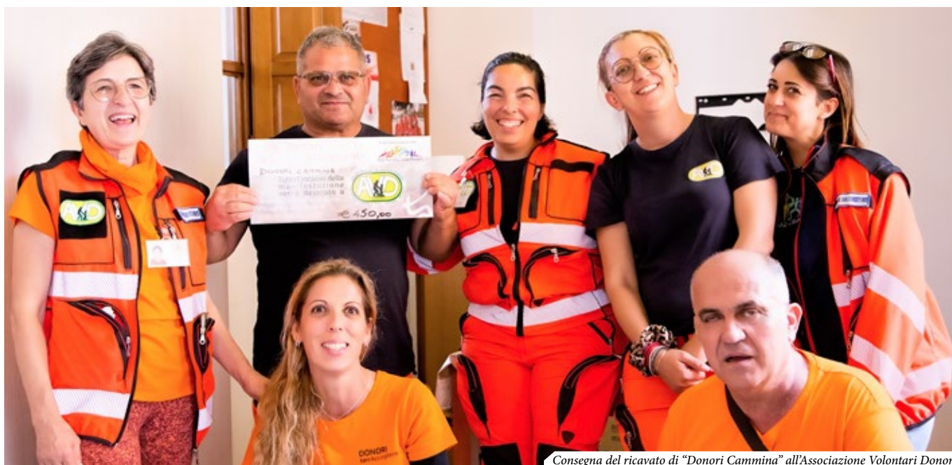
Consegna del ricavato di "Donori Cammina" all'Associazione Volontari Donori