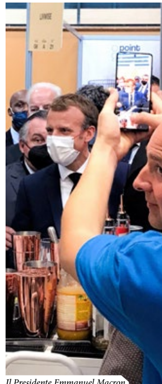
Il Presidente Emmanuel Macron

“Su Zinnibiri” ha invece avuto molto successo tra i buyer francesi, certamente ammaliati dai suoi tipici buchi, caratterizzanti delle gruviere svizzere. All'Expo di Lione, è inoltre venuto a far visita ai vari stand, compreso quello del caseificio “Antonio Garau”, un ospite molto speciale: il Presidente della Repubblica francese Em-