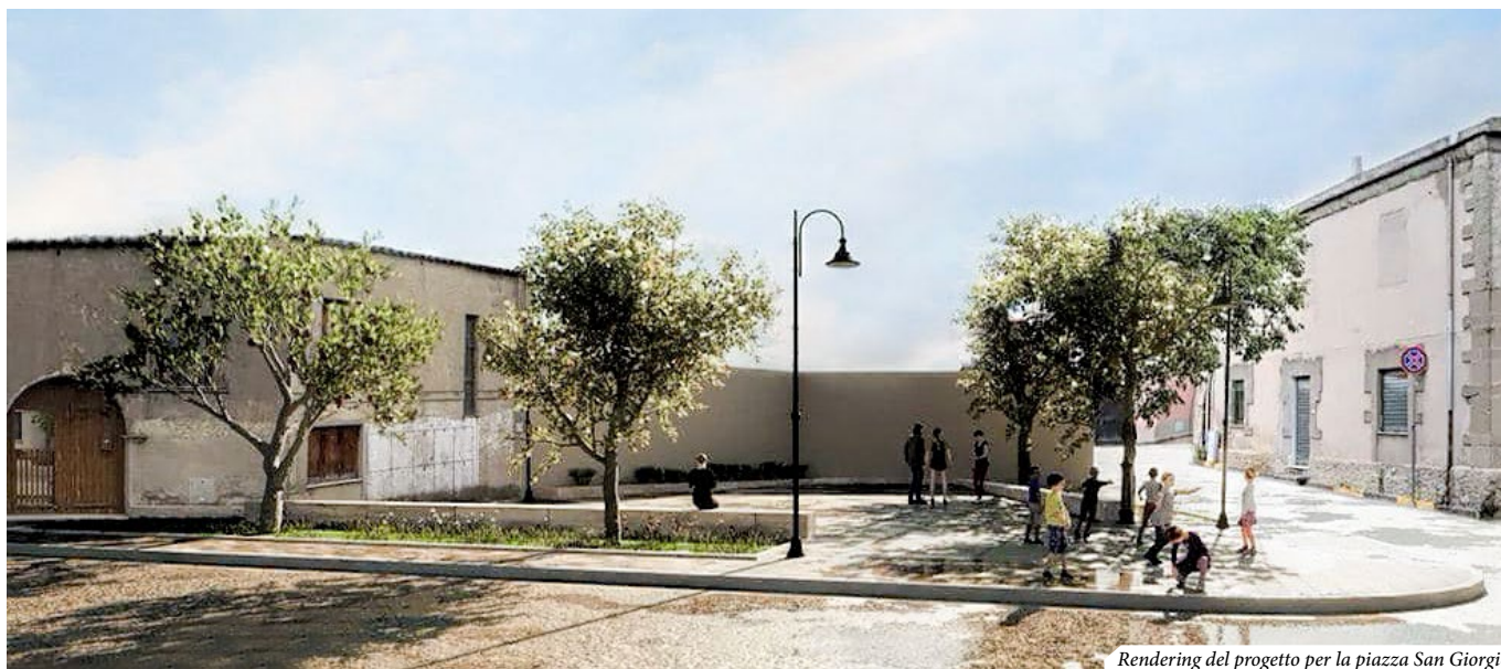
Rendering del progetto per la piazza San Giorgio